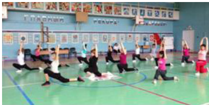
Мастер-класс «Body ART»

Ключевым событием стала «Открытая студия», которая была организована для обсуждения и согласования позиций и взглядов по вопросам здорового образа жизни. Внеи приняли участие представители управления образования Администрации г. Ачинска, руководители муниципальных образовательных учреждений г. Ачинска, участники и гости марафона.