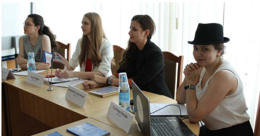
Участницы конкурса "Студенческий лидер" Красноярского края

Далее конкурсантки «погрузились» в правовые аспекты профсоюзной деятельности, вот где пришлось очень сильно поволноваться. Но стоит отметить, что волнение им ничуть не помешало, все правовые этапы были пройдены с достоинством.