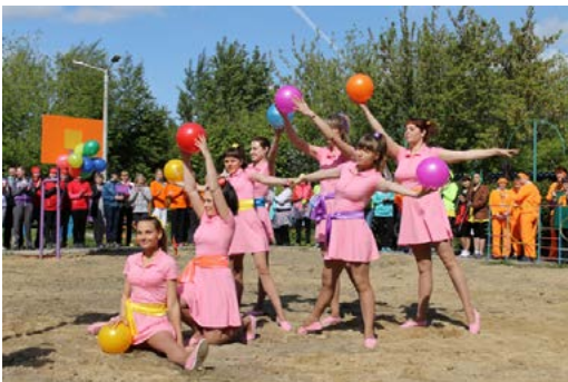
Творческий конкурс "Приветствие"

комитета Профсоюза, а также ценными спортивными подарками от районной