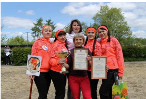
Команда победителей, д/с №319

комитета Профсоюза, а также ценными спортивными подарками от районной