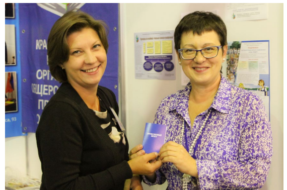
Вручение профсоюзного билета

В новом учебном году добавились не менее важные задачи, которые предстоит решать в условиях вновь обновленного законодательства: внесены существенные изменения в Трудовой и Гражданский кодексы РФ, утверждён профессиональный стандарт педагога, принят новый порядок аттестации