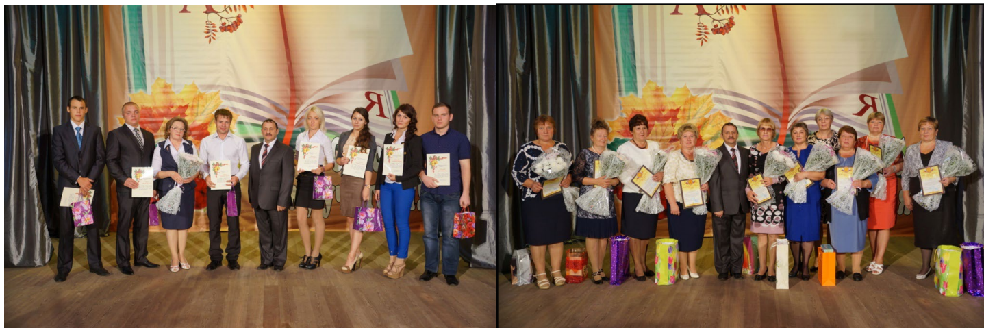
Торжественная церемония поздравления молодых педагогов и юбиляров