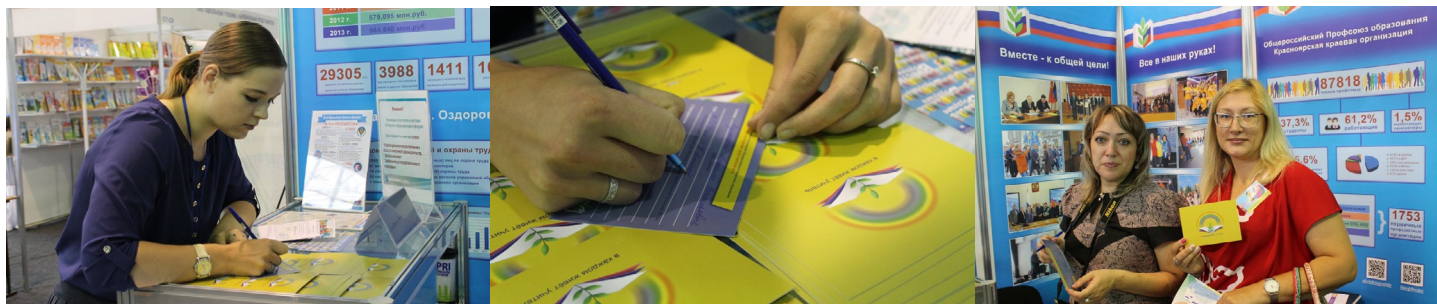
Участники акции "В каждом живет учитель"

В дни работы форума все желающие смогли получить консультацию специалиста по вопросам пенсионного законодательства и заключить договор с НПФ "Образование и наука".