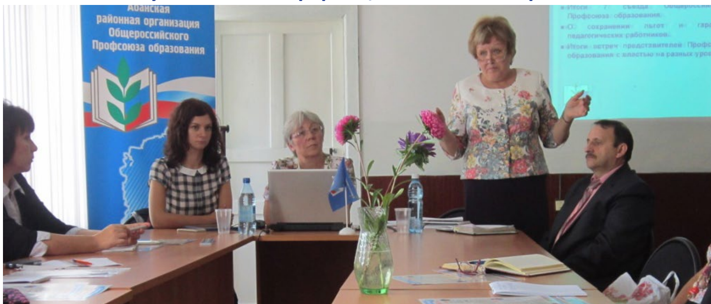
Тематическая секция «Роль первичной профсоюзной организации в создании условий для эффективной деятельности коллектива»