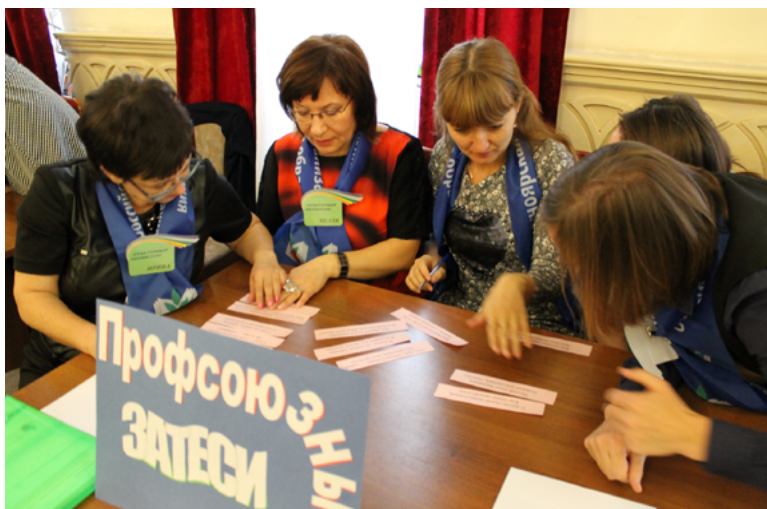
Команда "Профсоюзные затеси"

Участие в состязаниях позволило педагогам проявить собственные знания, творчество и эрудицию, умение принимать решения в нестандартных ситуациях в условиях ограниченного времени.